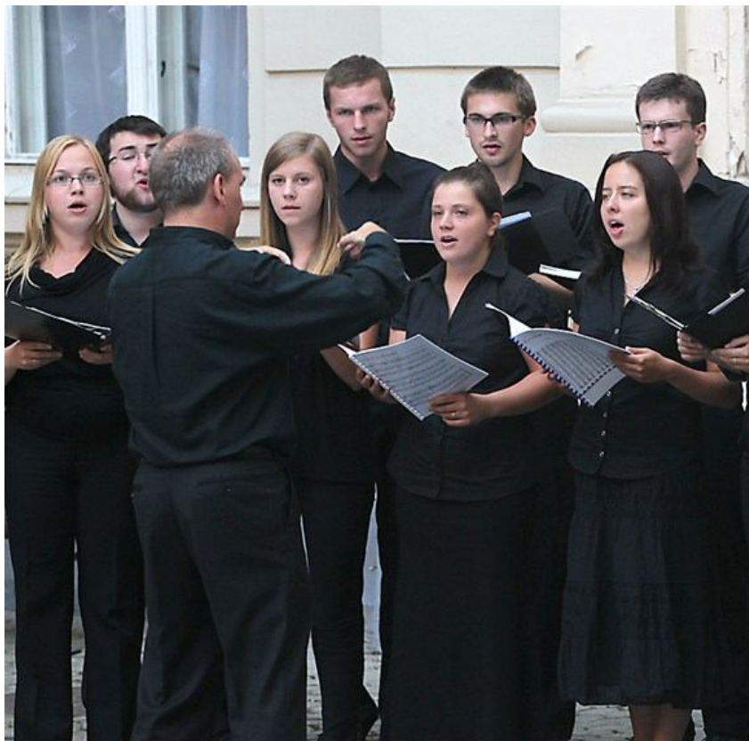
A Krakkói kórus Székesfehérváron

Köszönjük a szép estét a Krakkói Főiskola hallgatóinak!